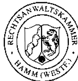
Dr. Finzel Präsident

Die Fortbildungsveranstaltung umfasste 5,0 Zeitstunden.